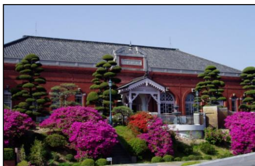
岡山市水道記念館