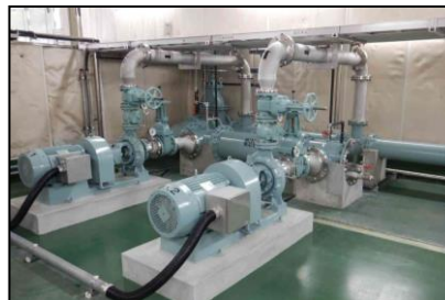
ポンプ設備の更新 (上土田加圧ポンプ場)