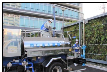
災害対策訓練 (給水基地で給水車への充水訓練)