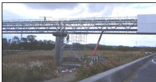
水管橋の塗装・点検