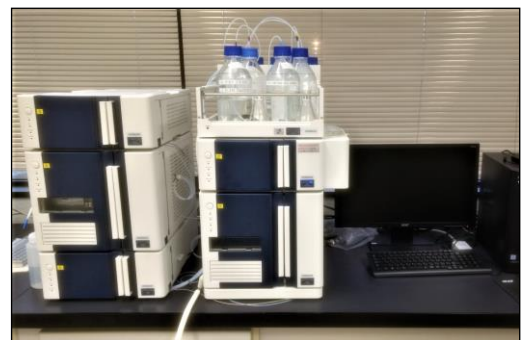
液体クロマトグラフ質量分析計

塩素処理の副生成物であるホルムアルデヒド、合成洗剤に使われている非イオン界面活性剤などを測定する機器