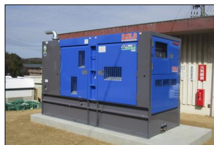
非常用発電機（妹尾加圧ポンプ場）