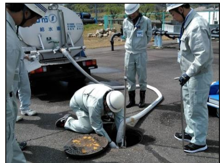
応急給水研修 (消火栓から給水車への充水)