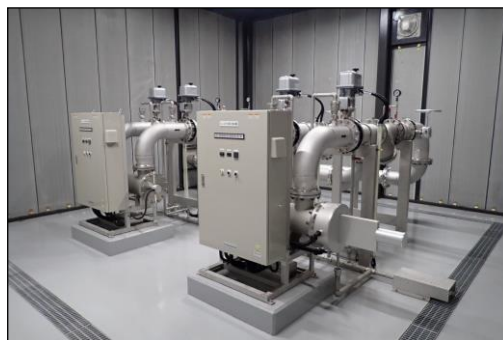
紫外線処理施設（矢原浄水場）