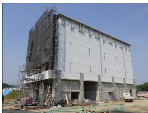
三野浄水場新脱水機棟

取水した原水を浄水処理する過程で取り除かれた河川中の濁り（土砂）などの沈でん物を、機械で圧力をかけて脱水する施設。脱水処理された浄水発生土は「おかやま産土」の名称で園芸用土として販売するとともに、セメント材等の原料としてリサイクル率100%を達成している。