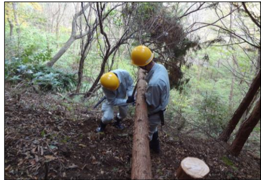
水源林事業（間伐作業）