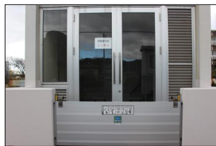
止水板の設置（三野浄水場）