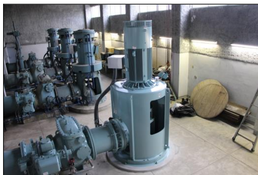
三野浄水場第5水源ポンプ