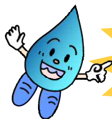
水道ぼうや スイスイくん