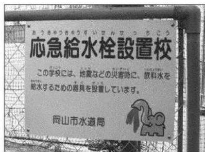
市立小中学校に設置している「応急給水栓設置校」の看板