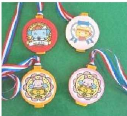
5. 水道メーター分解品の有効活用 黄色のフタは保育園や幼稚園の運動会のメダルなどに利用