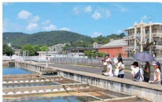
6. 水道局のイベント 6月の水道週間行事、夏休みや冬休みなどに親子で楽しめるイベントを実施しています。晴れたら浄水場見学も素敵です。

○廃棄水道メーターの分解分別は障がい者の就労機会拡大を支援するため、障害者就労継続支援B型事業所に委託しています。