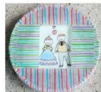
硬質ガラスは花を挟んだり、マスキングテープを使って、ペーパークラフト作り

○廃棄水道メーターの分解分別は障がい者の就労機会拡大を支援するため、障害者就労継続支援B型事業所に委託しています。