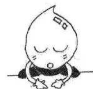
水道ほうや スイスくん

ご協力ありがとうございました。お寄せいただいた貴重なご意見は、今後の事業運営の参考とさせていただきます。