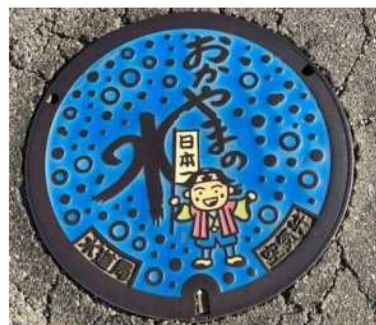
4. 水道の仕切弁や空気弁のデザイン鉄フタ 街を歩くと可愛い図柄のフタに巡り会えます。